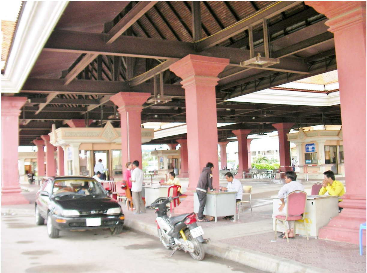
カンボジア出国手続き