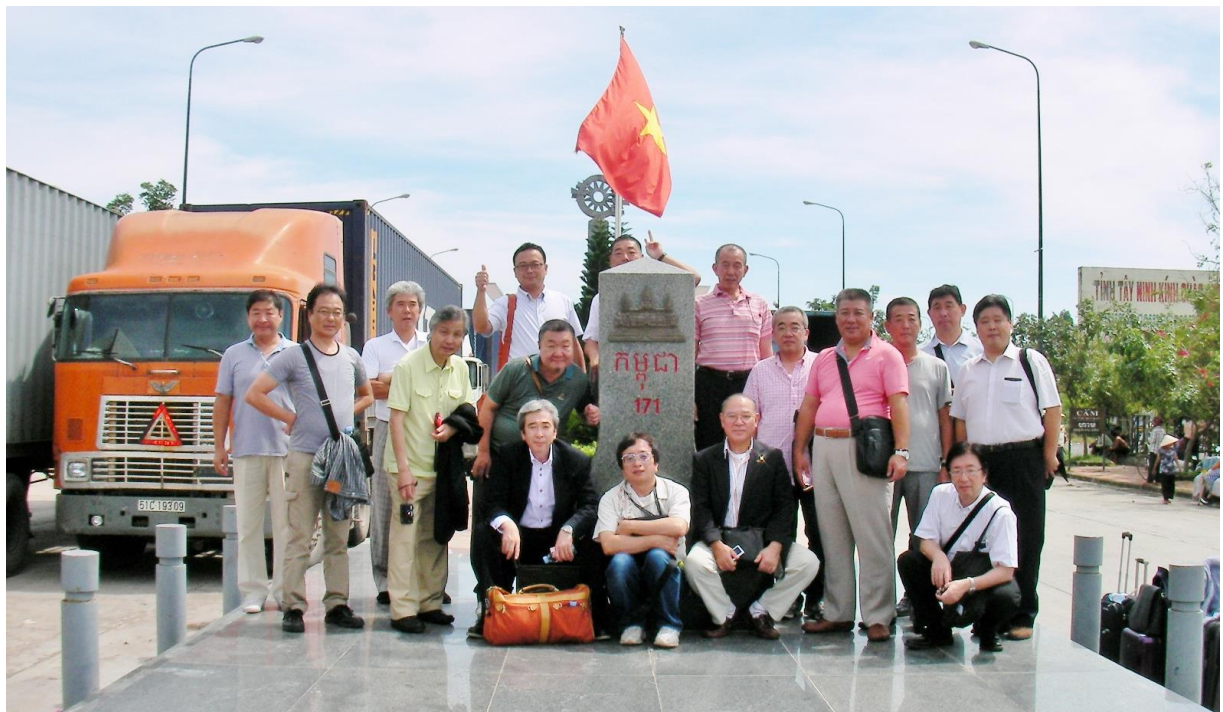
カンボジアとベトナムの国境 左手はベトナムからカンボジアに向かう車列