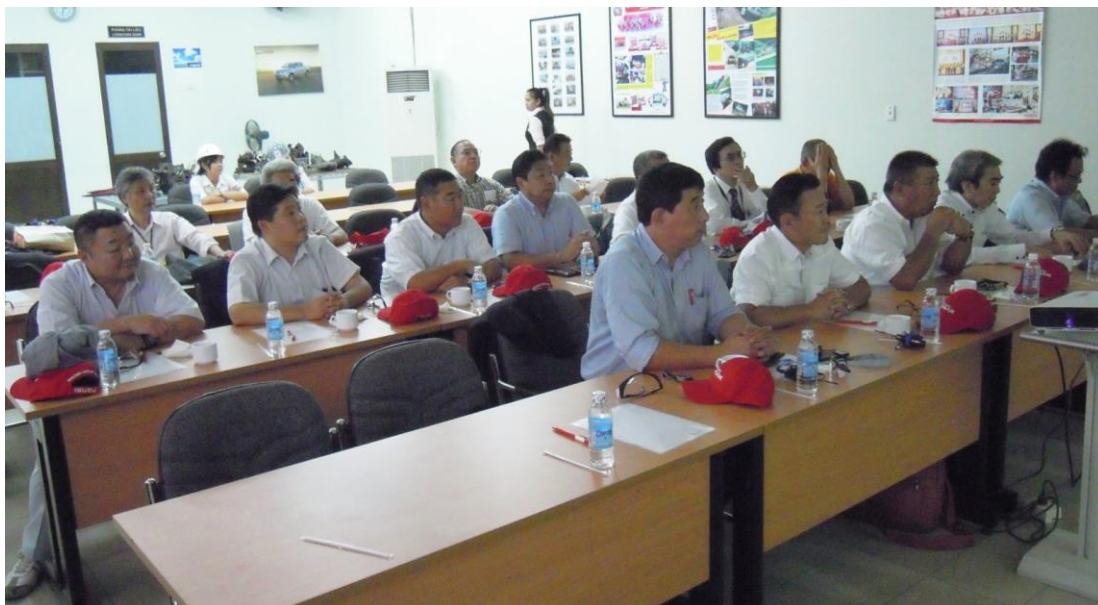
ISUZU VIETNAM CO.,LTD での研修