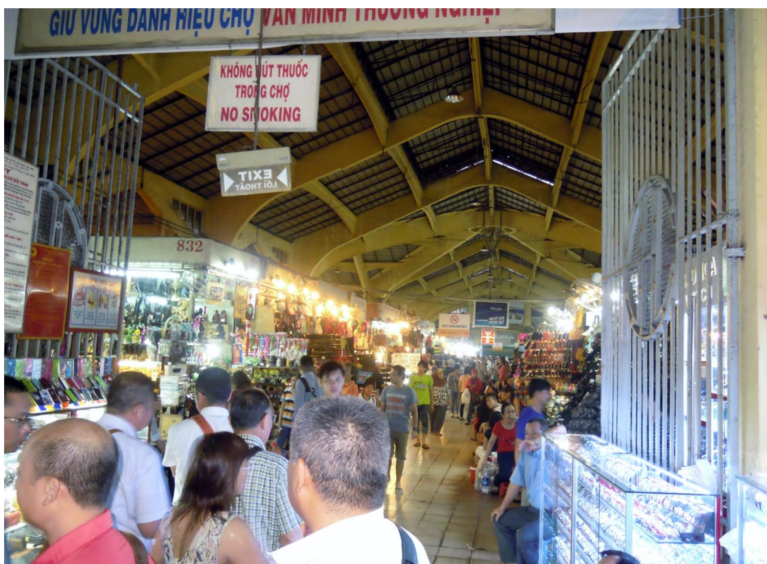
ベンダイ市場を視察