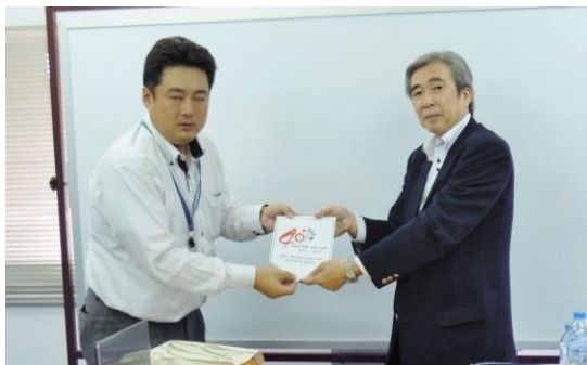
ロジスティクス研究会の記念ペナントより贈呈