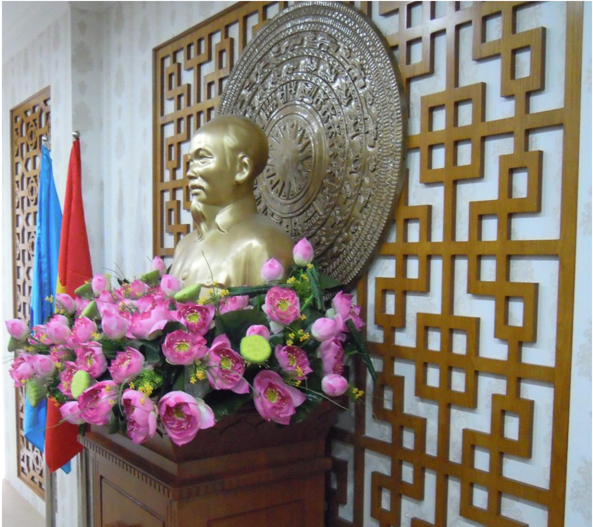
カットライ港会議室のホーチミン座像