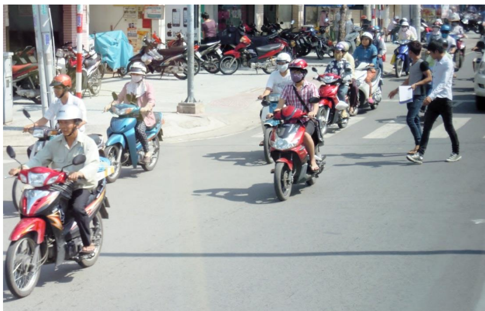
バイクと人と車が混在する道路（ホーチミン）