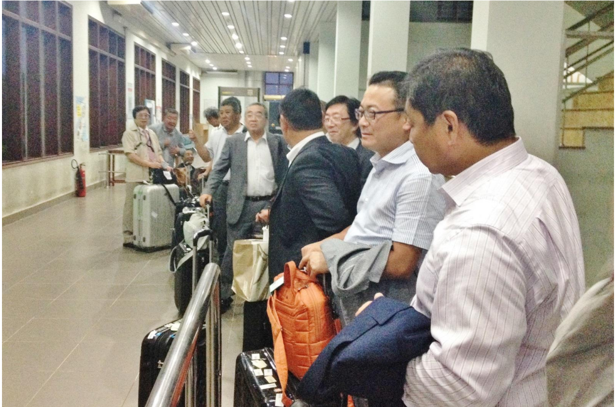
ベトナム出国手続き