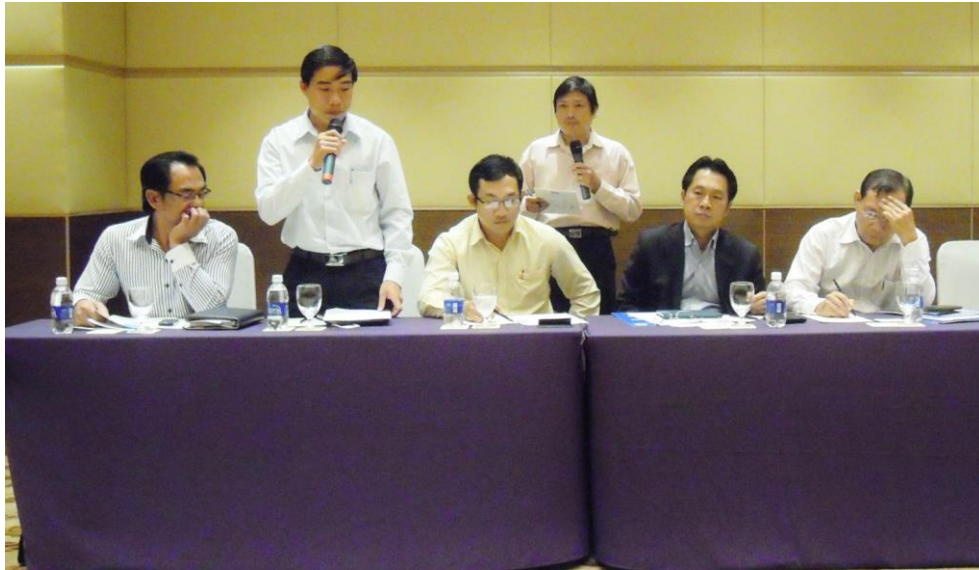
意見交換（ベトナム側席）