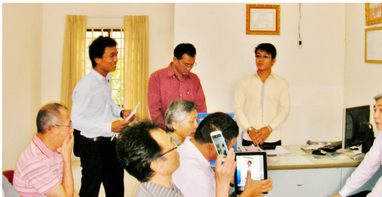
立っている左より通訳