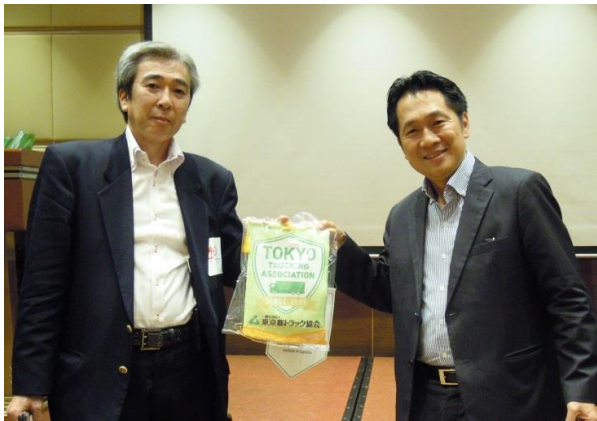
レ・デウイ・ヒェブ副会長

松本本部長挨拶、ベトナムロジスティックビジネス協会の副会長挨拶、ホーチミン市貨物輸送協会会長挨拶に続き、東京都トラック協会ロジスティクス研究会の説明、ベトナムサイドから自国の物流の実情についての説明を受ける。その後、双方より活発な意見交換が交わされた。両組織には東京都トラック協会とロジスティクス研究会の記念ペナントの贈呈を行った。