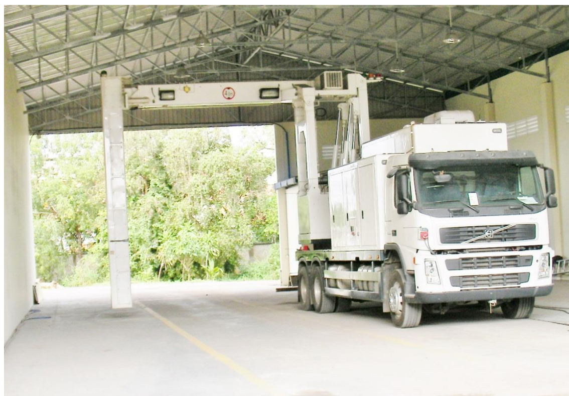
コンテナのレントゲンチェック施設