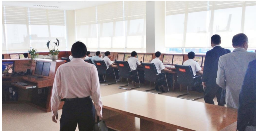
カットライ港管理室