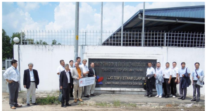
LOGITEM VIETNAM NO.2 HCM